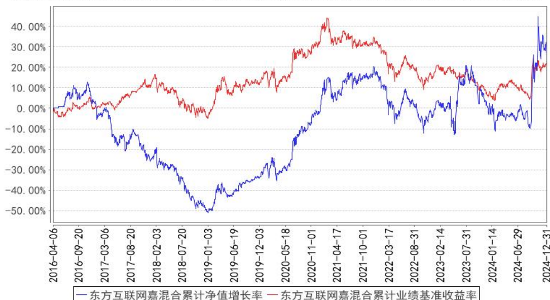
东方互联网嘉混合累计净值增长率与同期业绩比较基准收益率的历史走势对比图